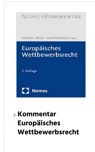
> Kommentar Europäisches Wettbewerbsrecht