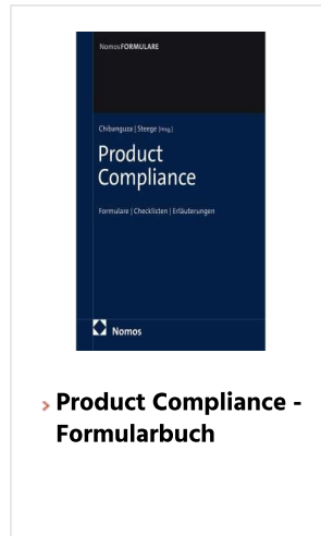
> Product Compliance - Formularbuch