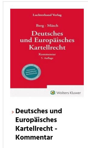
> Deutsches und Europäisches Kartellrecht - Kommentar