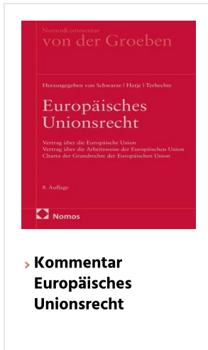
> Kommentar Europäisches Unionsrecht