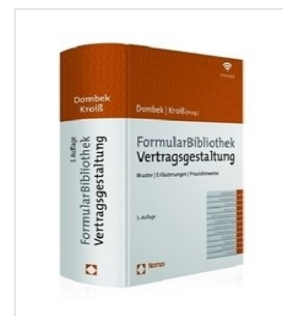
> FormularBibliothek Vertragsgestaltung - Privates Baurecht