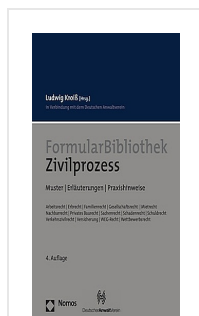
> Formular Bibliothek Zivilprozess