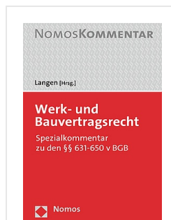
> Werk- und Bauvertragsrecht