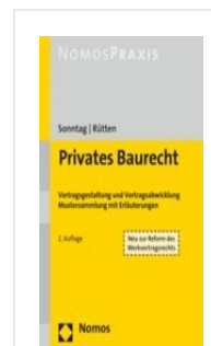
> Privates Baurecht