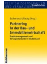
› Partnering in der Immobilien- und Bauwirtschaft