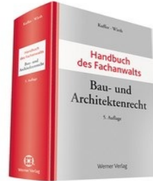
› Handbuch des Fachanwalts Bau- und Architektenrecht