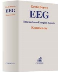
› Erneuerbare- Energien-Gesetz: EEG