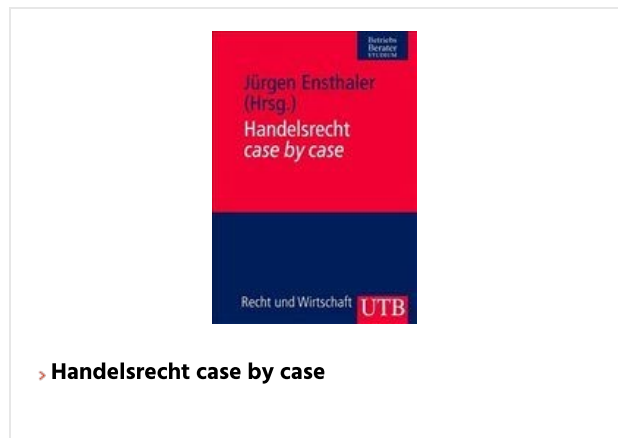
› Handelsrecht case by case