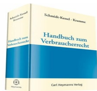
› Handbuch zum Verbraucherrecht