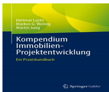
› Kompendium Immobilien-Projektentwicklung