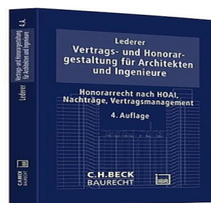
› Vertrags- und Honorargestaltung für Architekten und Ingenieure - Honorarrecht nach HOAI, Nachträge, Vertragsmanagement