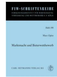
> Marktmacht und Bieterwettbewerb