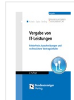
> Vergabe von IT-Leistungen