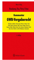
> Kommentar zum GWB-Vergaberecht