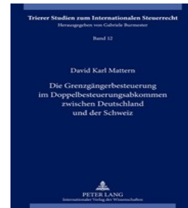
> Die Grenzgängerbesteuerung im Doppelbesteuerungsabkommen zwischen Deutschland und der Schweiz