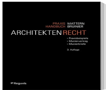
> Praxishandbuch Architektenrecht