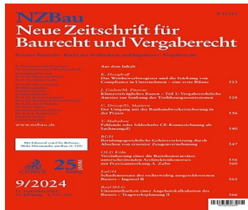
> NZBau Heft 9/2024