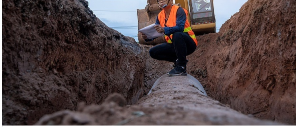
> Tiefbau: Kapellmann begleitet RAEDER bei Übernahme durch TERRAS