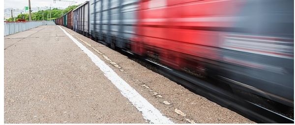
> Kapellmann begleitet Vossloh bei Übernahme des RailWatch-Geschäfts