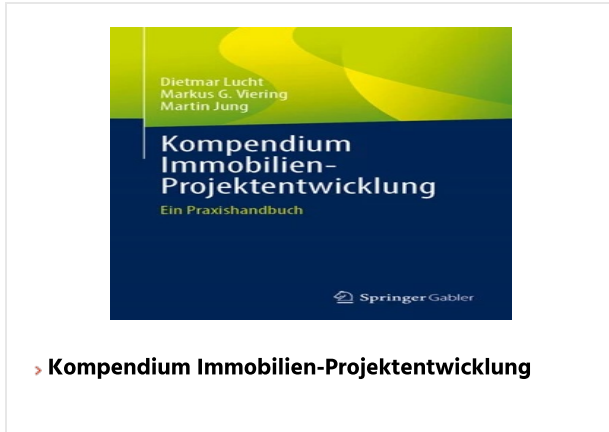
› Kompendium Immobilien-Projektentwicklung