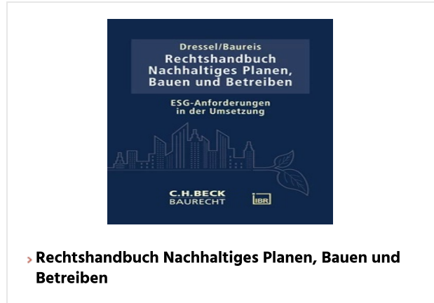
› Rechtshandbuch Nachhaltiges Planen, Bauen und Betreiben