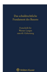
› Das schuldrechtliche Fundament des Bauens - Festschrift für Werner Langen zum 65. Geburtstag