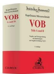
› VOB Teile A und B - Vergabe- und Vertragsordnung für Bauleistungen mit Vergabeverordnung (VgV)