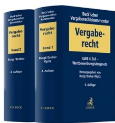
› Beck'scher Vergaberechtskommentar