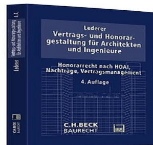
> Vertrags- und Honorargestaltung für Architekten und Ingenieure - Honorarrecht nach HOAI, Nachträge, Vertragsmanagement