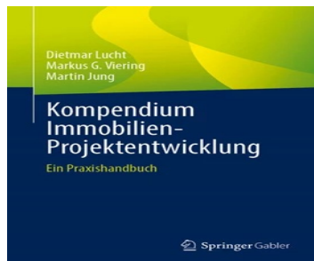
> Kompendium Immobilien-Projektentwicklung