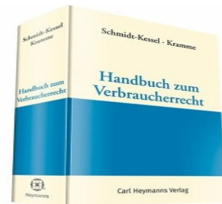
> Handbuch zum Verbraucherrecht