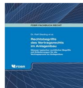
› Rechtsbegriffe des