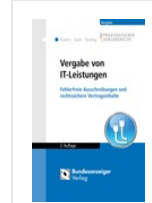
> Vergabe von IT-Leistungen