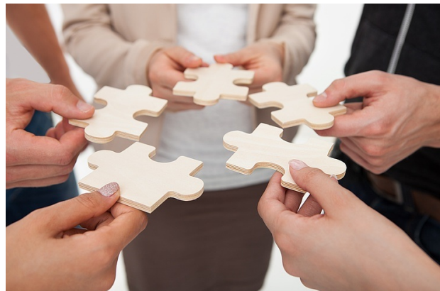
> Das Vergabetransformationspaket - 2023 unter dem Weihnachtsbaum?