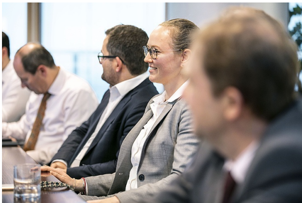
> Referentenentwurf zum Vergabebesleunigungsgesetz: Was wird die Reform bringen? Eine Übersicht über die wesentlichen aktuell vorgesehenen Inhalte