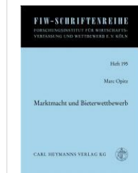
> Marktmacht und Bieterwettbewerb