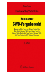
> Kommentar zum GWB-Vergaberecht