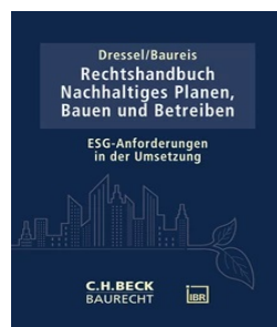
› Rechtshandbuch Nachhaltiges Planen, Bauen und Betreiben