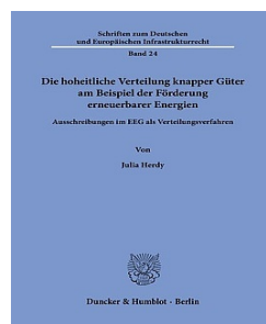
› Die hoheitliche Verteilung knapper Güter am Beispiel