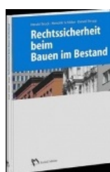
› Rechtssicherheit beim Bauen im Bestand