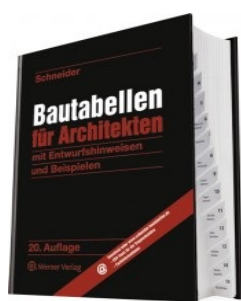
› Bautabellen für Architekten