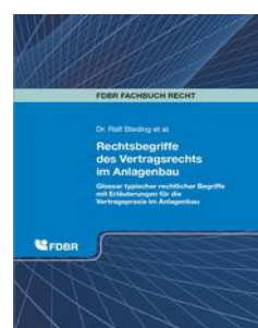
› Rechtsbegriffe des Vertragsrechts im Anlagenbau