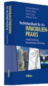
› Rechtshandbuch für die Immobilienpraxis