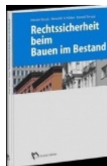
› Rechtssicherheit beim Bauen im Bestand