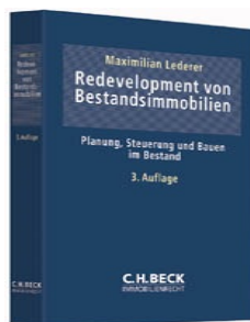
› Redevelopment von Bestandsimmobilien