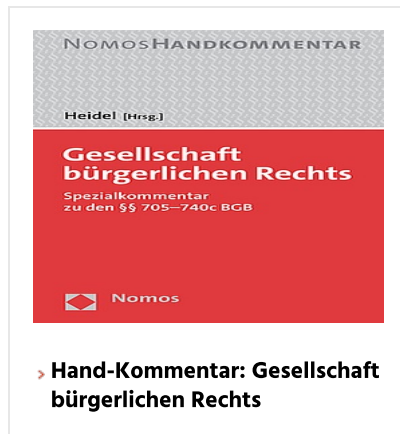
› Hand-Kommentar: Gesellschaft bürgerlichen Rechts