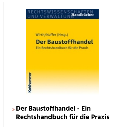
› Der Baustoffhandel - Ein Rechtshandbuch für die Praxis