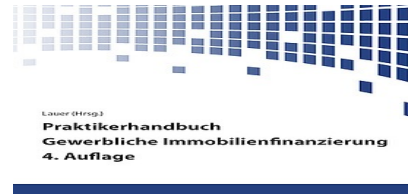
> Praktikerhandbuch Gewerbliche Immobilienfinanzierung