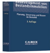
› Redevelopment von Bestandsimmobilien