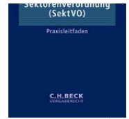
› Sektorenverordnung (SektVO)