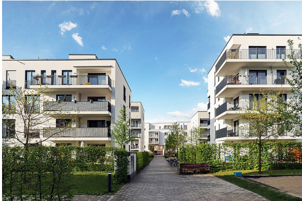
> Der „Wohnungsbau-Turbo“ ist in Kraft getreten