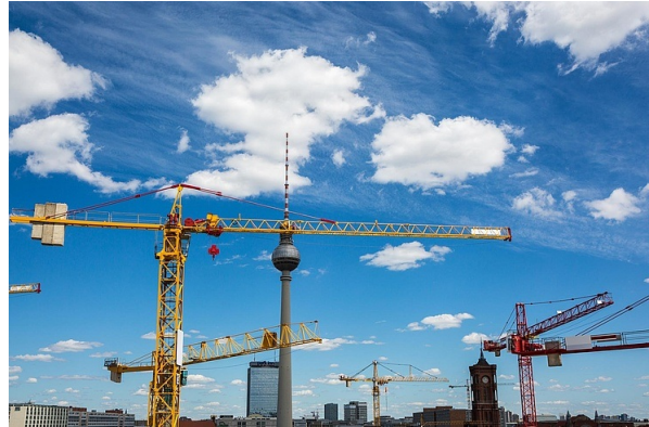
> Das Berliner „Schneller-Bauen-Gesetz“ ist in Kraft getreten